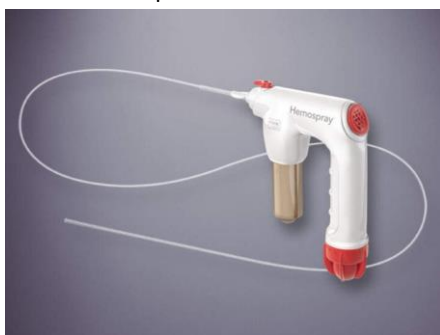
Fig 2. Uso del dispositivo Hemospray®)